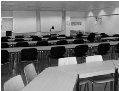
Schulungsstätte und Prüfungszentrum der SGZP

gbd Swiss AG Schneidersmatt 32 3184 Wünnewil Schweiz